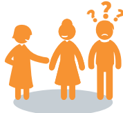
Gesprächen nicht mehr folgen können