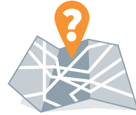
Fehlende Orientierung zur Zeit und an fremden Orten