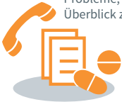
Probleme, den Überblick zu behalten