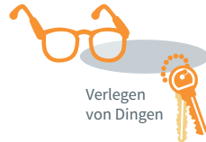
Verlegen von Dingen